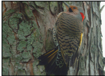
Depredadores. Pájaro en busca de insectos para alimentarse.