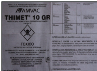
Panfleto Técnico. Entender y seguir especificaciones de panfleto técnico se traduce en seguridad.