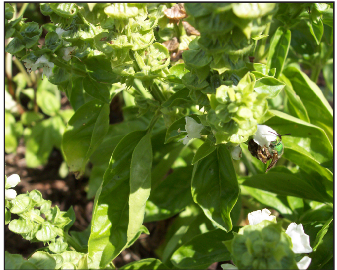
Planta Floral Fuente de Alimento

Entre las ventajas que se tienen con la utilización de esta estrategia, están: