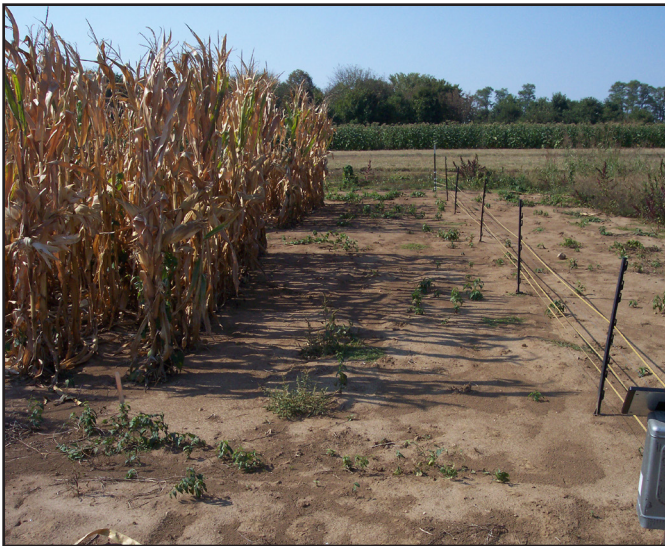
Cultivo de Maíz con Barrera Física