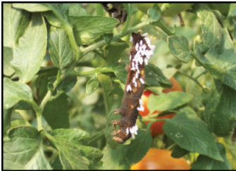
Parásitos. Gusano cornudo muerto por insecto parasitoide.