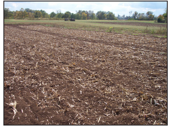
Incorporación de Rastrojos al Suelo

La elaboración de un plan de actividades, debe preceder a la implementación de un programa MIP. El plan debe prepararse antes de sembrar y debe incluir los métodos de control que se utilizarán con las plagas que atacan el cultivo, esto implica establecer tiempos, labores, materiales, químicos y otros que se consideren importantes. Este plan ordena el trabajo a realizar, aunque no necesariamente es la única herramienta para la toma de decisiones.