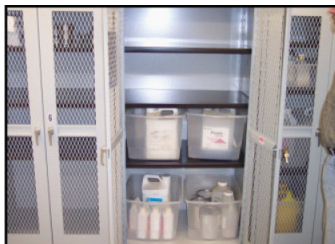
Modo de Acción. ¿Ingestión o contacto? ¿Que plaguicida se necesita?