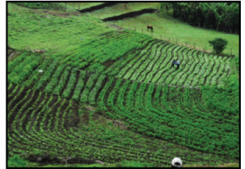
Rotación. Rotación de cultivos para retardar la infestación por plagas del cultivo.