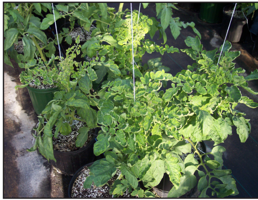
Cultivo de Tomate con Presencia de Plaga

De ser posible, los pesticidas deben comprarse en envases pequeños, de tal forma que puedan utilizarse y consumirse totalmente en la etapa de cultivo. Seleccionar pesticidas, que no requieran