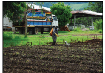
Aplicación. Aplicar dosis de producto apropiada y con la frecuencia recomendada.