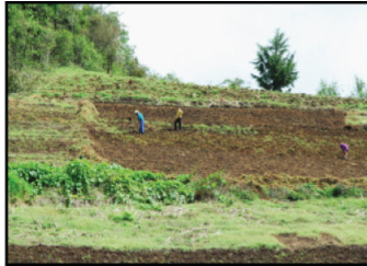
Fecha de Siembra. Cambiar la fecha de siembra, evita tener plantas vulnerables cuando hay mayor presencia de plagas.