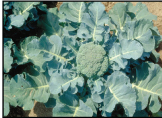
Variedades. Uso de variedades resistentes que puedan tolerar, evitar y recuperarse de daños.