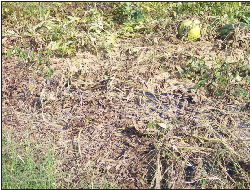
Cultivo de Sandía Afectado por Enfermedad