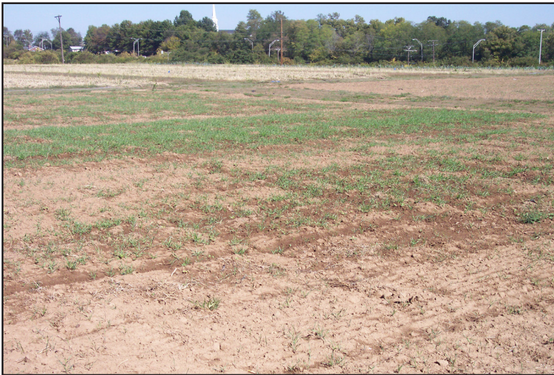
Cultivo de Cobertura en Suelo Agrícola