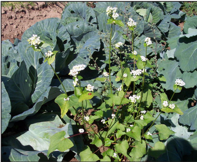
Planta Floral Fuente de Alimento