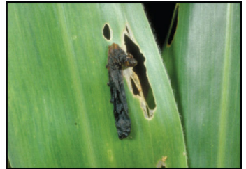
Patógenos. Gusano atacado y muerto por virus.