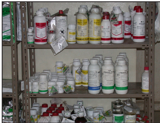
Almacenamiento de Plaguicidas

un largo período de espera (carencia) entre la aplicación y la cosecha, existiendo habilitación cuando la producción está lista.