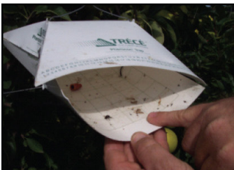
Nivel de Daño Económico. Determinar el umbral de acción antes que la plaga lo alcance.