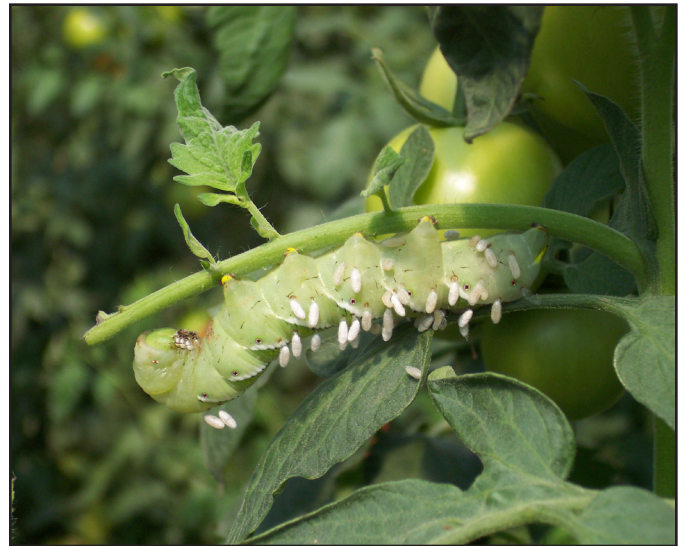
Gusano Cornudo Parasitado

El control mecánico está relacionado con los siguientes usos: