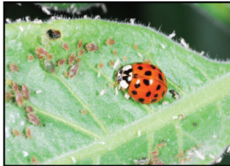
Depredadores. Mariquita alimentándose de áfidos o pulgones.