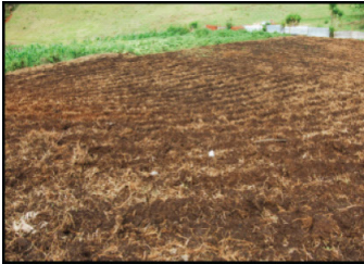
Rastrojos. Incorporación de rastrojos al suelo para eliminar hospederos de plagas.