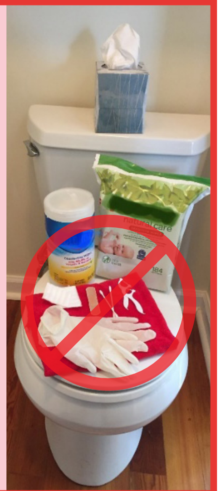
Figura 2. Deseche en el inodoro solo los artículos apropiados (primera imagen). Use un bote de basura para deshacerse de los otros artículos (segunda imagen).