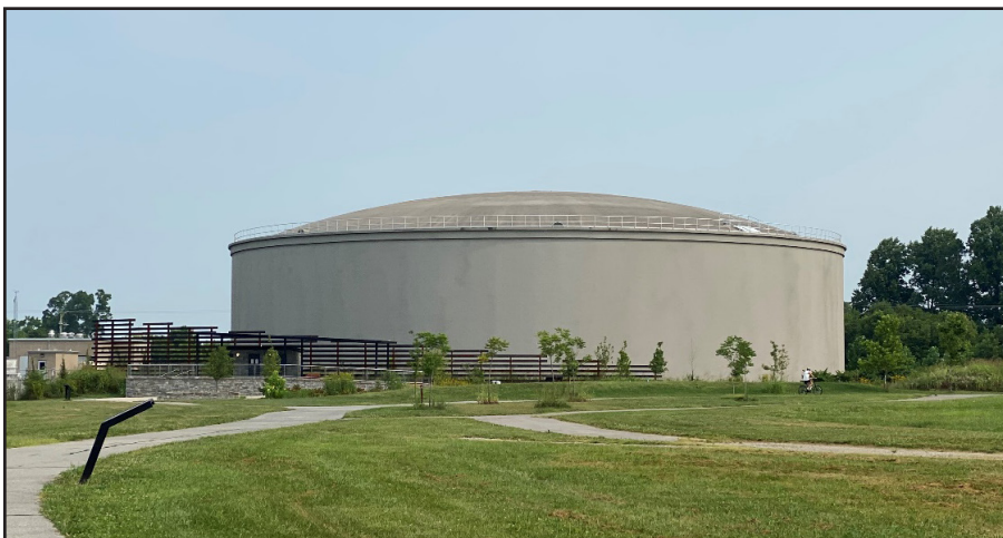
Figura 4. Un tanque de almacenamiento para clima húmedo diseñado para manejar el exceso de carga de alcantarillado sanitario durante eventos de alto flujo.

Las áreas con problemas de desbordamiento de alcantarillado sanitario documentados en Lexington, Kentucky se identifican con letreros de advertencia que proveen información sobre los peligros potenciales asociados con la exposición (Figura 5). Si es testigo de un desbordamiento de alcantarillado activo en Lexington o ve evidencia de uno reciente, por favor notifique a LexCall marcando 311 o llame al (859) 425-2255.