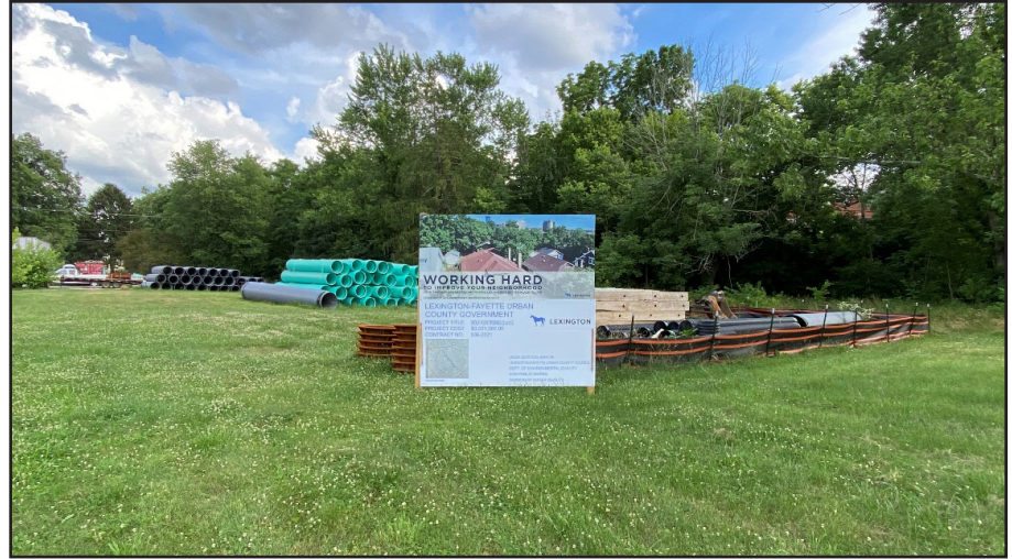
Figura 3. Un patio de preparación para un proyecto de reemplazo de una línea de alcantarillado en la Wolf Run Watershed (cuenca).

La ciudad de Lexington está adoptando un enfoque multifacético para corregir el problema de desbordamientos de alcantarillado sanitario. El enfoque general es reemplazar las líneas de alcantarillado y mejorar la capacidad del sistema de alcantarillado sanitario (Figura 3). La ciudad también está instalando tanques de almacenamiento para clima lluvioso (Figura 4) para manejar cargas excesivas durante las temporadas de lluvias inten-