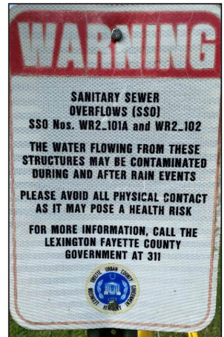
Figura 5. Un letrero de advertencia que notifica a los residentes sobre los riesgos para la salud asociados con los desbordamientos de alcantarillado sanitario.